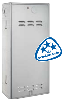
VELA COMPACT IN