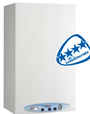
PICTOR CONDENSING LINE TECH