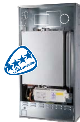
PICTOR CONDENSING IN